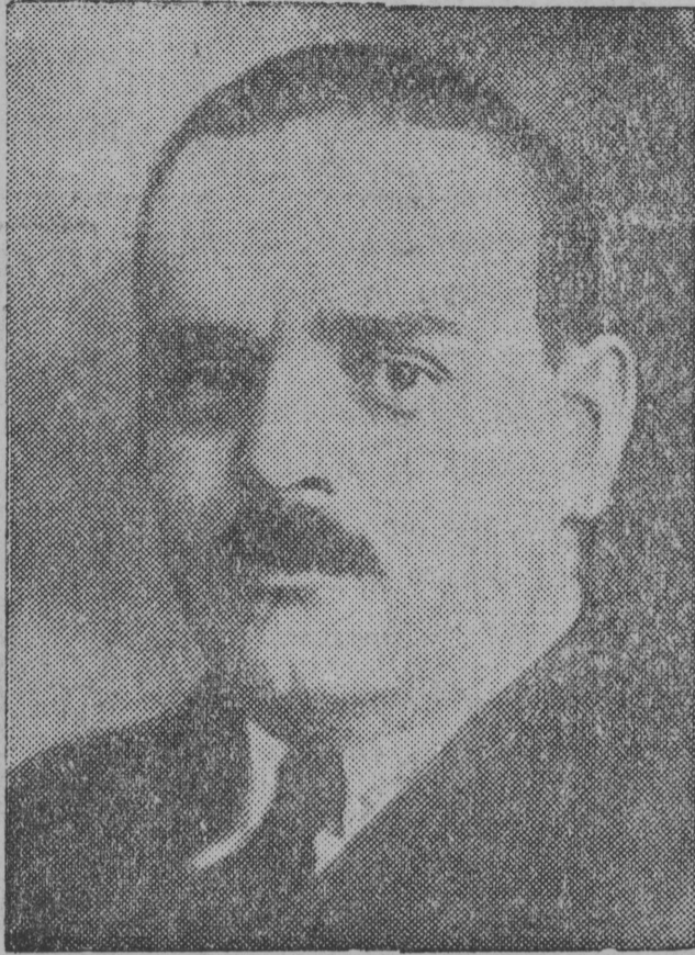
Николај Михајлович ШВЕРНИК