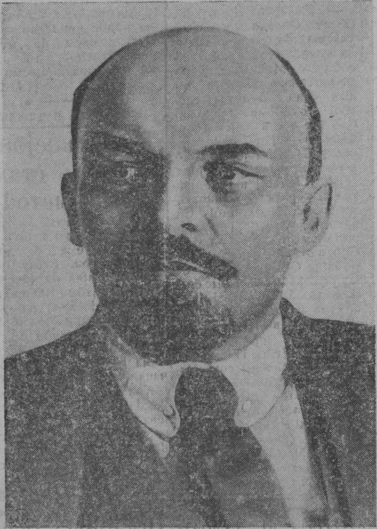
В. І. Лењин (1870—1924)

ГАЗЕТ ЛЕҢОНЫ: ВКП(б) ЛЕМДИНСА РАЈКОМ, ДА РАЈСПОЛКОМ