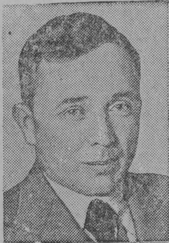
СНМОК ВВЛЫН: штурман А. М. Бр'андінскіј јорт.

Героіческдј лдсдччдм СССР Верховнја Сдветса депутат лдтчк-высотнк В. Кокківак јорт да замечателнја штурман А. Бр'андінскіј јорт вдчсны тддччана пуксывлытдм лдсдччдм Москва—Владівосток рајонд, кодјас лдсдсны сдкыт туд куза 24 час 36 минутн 7.600 кілометра до-рыс унжык.