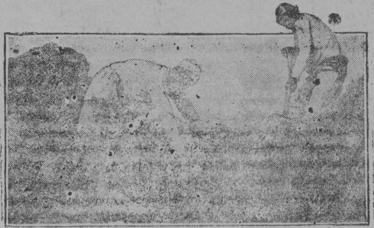
НА СНИМКЕ: Заготовка клевера в колхозе им. Сталина (Старая Бухара Узбекистан.)

Расширим нормовую базу социалистического животноводства