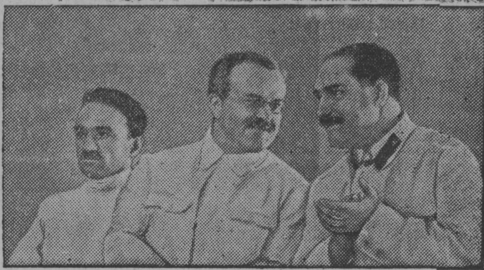
На снимке (слева направо): А. И. Миколян, В. М. Молотов и Л. М. Каганович в ложе Совнаркома на первом заседании сессии.