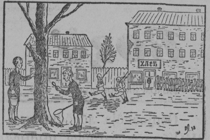
—По моему это хлебное дерево, ведь из его опилок выпекают хлеб.