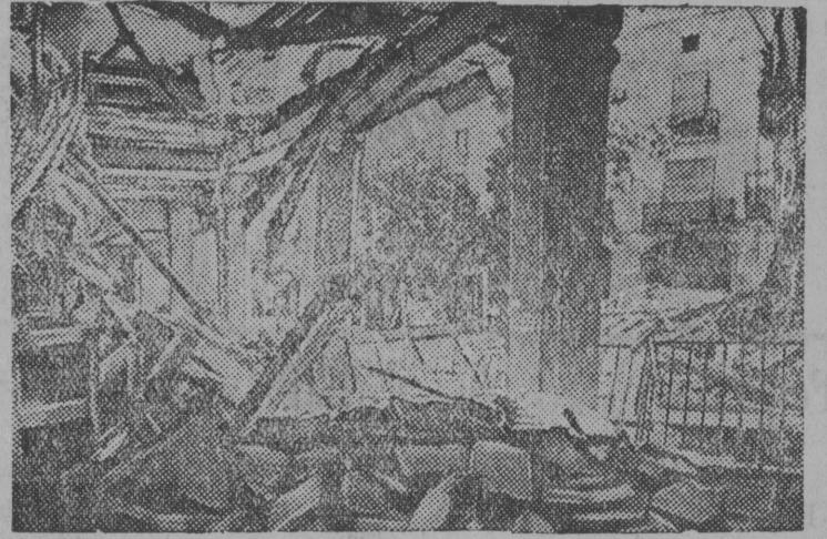
Сн. вылын: Керкајас, Каталоніјаса өтi карын, кодөс разрушитөма итало-германскөй самолөтјас бомбардирүјтөмөн.