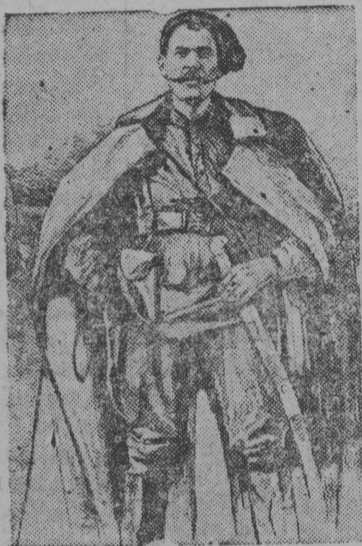
В. И. Чапаев.

Талун, сентябрь 5 лун'о, тырис 20 во гражданск'ой войनावывса герой, м'иан р'одинал'он пламенн'ой патриот—В. И. Чапаев кул'ом лунсян.