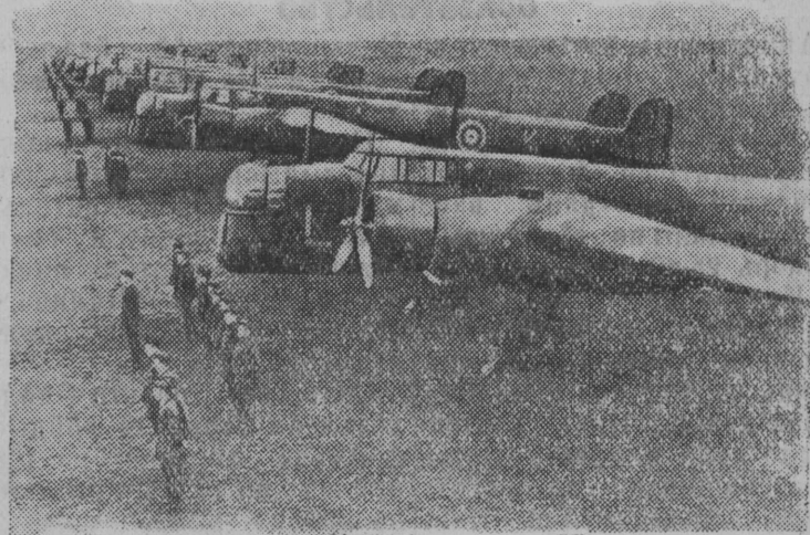
„Мерлин“ бомбардировщикяе старт вылынбөс.