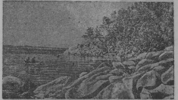
Боровое курорт (Северо-Казахстанской обл.) Голубой залы.

Та вылын первой сов- местной заседание кыян палаталөн тупкысьё. Мёд совместной заседание на- значитюма август 2-од лунё 6 час рытын. (ТАСС).