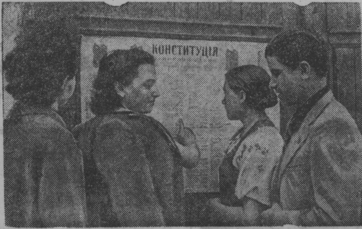
Кишинев карса олысьяс лядьбны Сталинскэй Конституция.