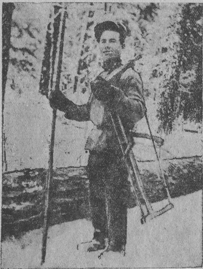
Менам пөрөдчан инструментјас.

13 час да 07 мінутаоң декабр 10-өд лунө менам вө-лі пөрөдөма 23 пу либө вөчөма 15,7 — кубометр.