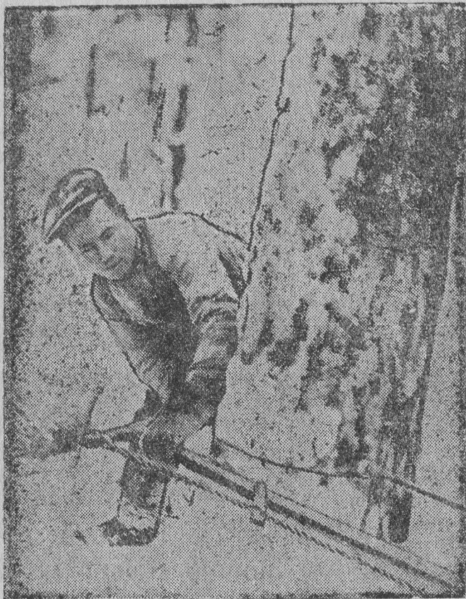
Лучковöј піладн пөрөдчөм.

Вескыда шуа, мыј ташöм ыжыд уждон н јывсыс ме весіг некор мөвпыштлыны ег лыстлы. Казтывла