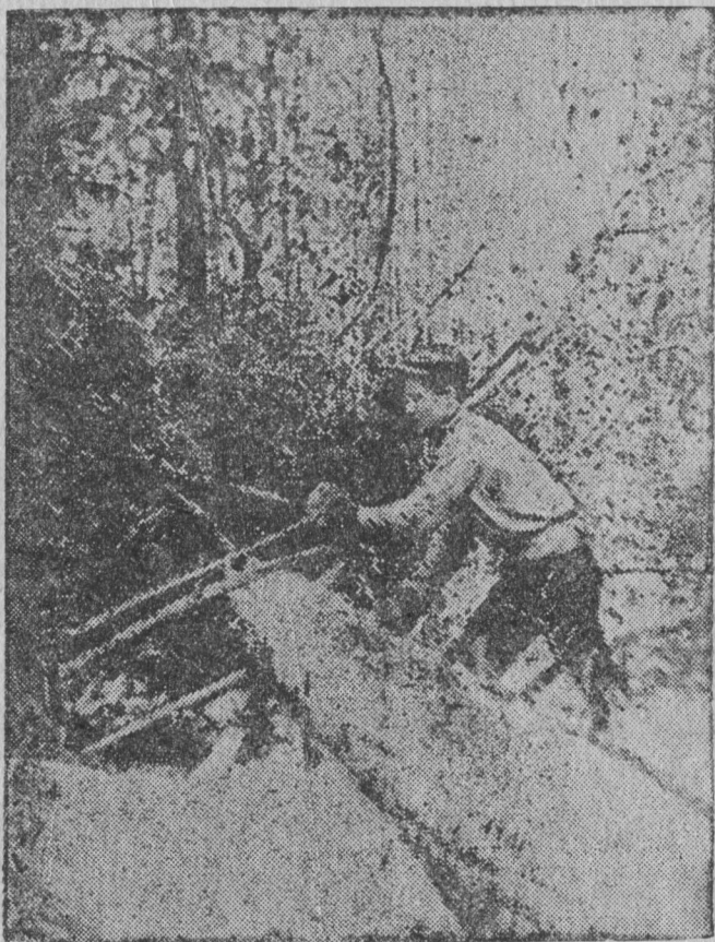
Лучковӧй пiлаӧн чiнтасӧм.

лоӧ 2 \frac{1}{2} кiлогрaмм. Чер пуыс абу куз (63 сантиметр). Чер лечыд. Ужала ӧтi черӧн, но запас вылӧ сӧрыс век-жӧ вiзa мӧдӧс. Тазжӧ ескӧ колӧ снабдiтны i запаснӧй мӧд лучковӧй пiлаӧн.