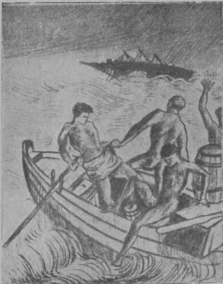
Пыж мбѣѣчѣс караб дѣсанъ гѣа море вывтѣ.