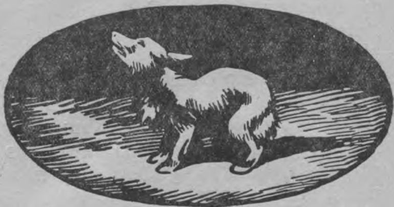
Каштанка помөз усі сөлөмнас, повзіс.

Кор лоі зік пемыд, Каштанка помөз усі сөлөмнас, повзіс. Сіјө топөдчіс кущөмкө