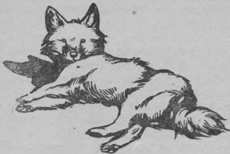
Каштанка водіс волпас вылө.

вижодлас да став суставјасыс мөдласны вiс-ны. Феџушка щөктывліс сіјөс ветлөдлыны бөр кок јылас, жыңнан пыџди вөчлывліс, мөд ног-кө — зев чорыда тракјөдліс бөжө-