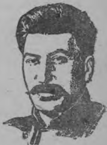
Иосиф Виссарионович Сталин.