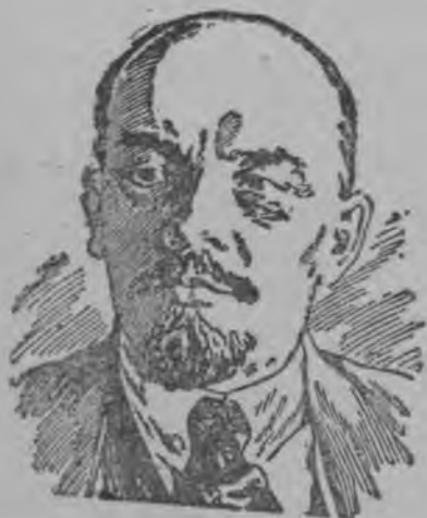
Владимир Ильич Ленин.

23 уж. Портретъёс улысь гожтэмъёсыз ас тетрады- ды гожтэ. Кыче букваэн нимез, аи нимез но фамилля- эз гожтоно?